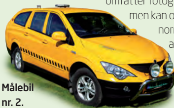
Målebil nr. 2.

Fotoene koordinatfestes til den aktuelle veien. Normalt skjer dette med angivelse av veinavn, dato, klokkeslett, kilometring, GPS-koordinater, angivelse av kjørefelt eller kjøreretning på det enkelte digitale bildet. Veiteknisk Institutt har to målebiler hvorav en mindre personbil (målebil nr. 2) for fotografering av kommunale veier og smale gang- og sykkelveier.