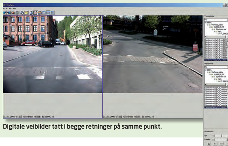
Digitale veibilder tatt i begge retninger på samme punkt.

Målebil nr. 2 tar i tillegg automatisk bilder i begge retninger samtidig. En trenger da normalt ikke fotografere veien ved å kjøre i begge retninger.