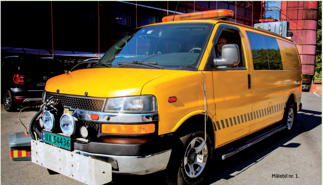
Målebil nr. 1.