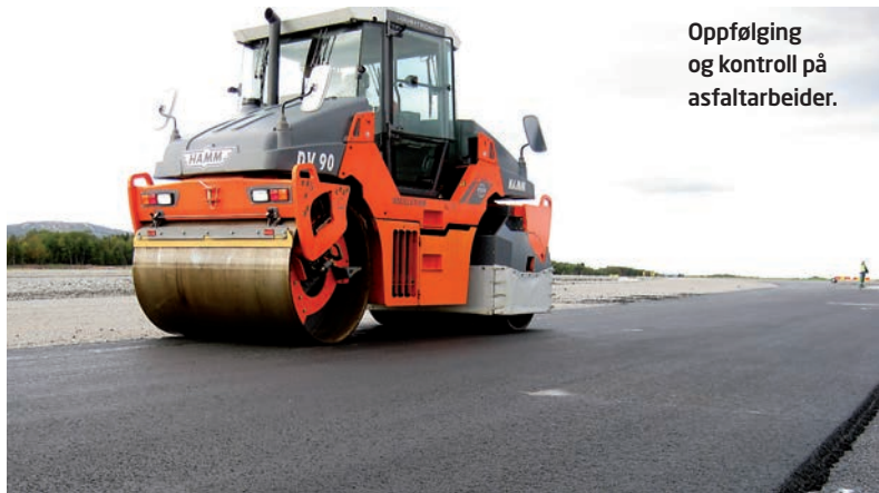
Oppfølging og kontroll på asfaltarbeider.

Fra 1. januar 2011 skal også produksjon av bitumen og bitumenemulsjon være sertifisert, og vi tilbyr også denne tjenesten i samarbeide med Kontrollrådet.