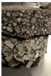
Bestemmelse av hulrom og densitet.

■ Veiteknisk Institutt utfører asfaltanalyser av veier og flyplasser. De vanligste parametrene er hulrom, korngradering og bindemiddelinnhold. Utover dette kan vi påta oss oppdrag på uttak og analyser av borkjerner. Dette vil sammen med tilstandsmålinger vi utfører, gjøre oss i stand til å tilby komplette løsninger for dokumentasjon av asfalt. I tillegg vil det styrke vår posisjon som en faglig nøytral 3. part.