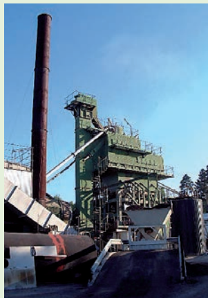
Asfaltproduksjon i hht CEN-standarder.

Det påligger asfaltprodusenten å ha dette i orden,